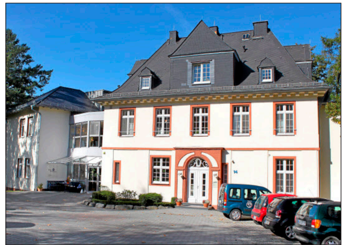
Im ehemaligen Stabsgebäude an der Wetzlarer Spilburg ist das Hospiz „Haus Emmaus“ untergebracht. Damit das so bleibt, muss das Haus gekauft werden.

Die Gäste im Haus Emmaus sind unheilbar krank und können zu Hause nicht gepflegt und versorgt werden. Sie sollen die letzten Tage ihres Lebens menschenwürdig, selbstbestimmt und möglichst schmerzfrei verbringen können. „Im Mittelpunkt unserer Arbeit stehen schwerstkranke und sterbende Menschen“, heißt es in den Leitlinien des Hauses Emmaus. Die Gäste