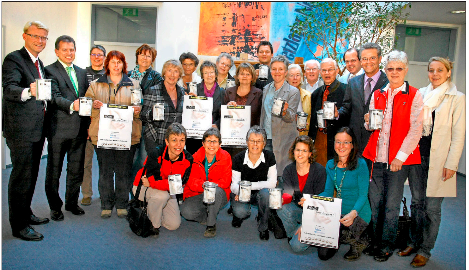
Ausgestattet mit Sammelbüchsen und Plakaten: Vertreter und Förderer des Hospizes Mittelhessen und dieser Zeitung sammeln gemeinsam mit dem Verein „Helft uns helfen“ Spenden für den Erhalt des „Hauses Emmaus“ in Wetzlar.